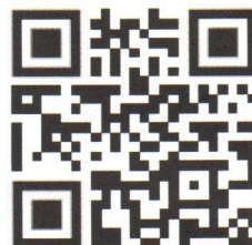
ดาวน์โหลดแบบฟอร์มสรุปบันทึกการอ่าน ของนักเรียนในแต่ละระดับชั้น