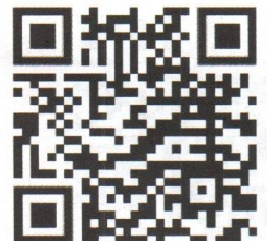
ติดตามข่าวสารกิจกรรมต่าง ๆ FB: Nanmeebooks Reading Club